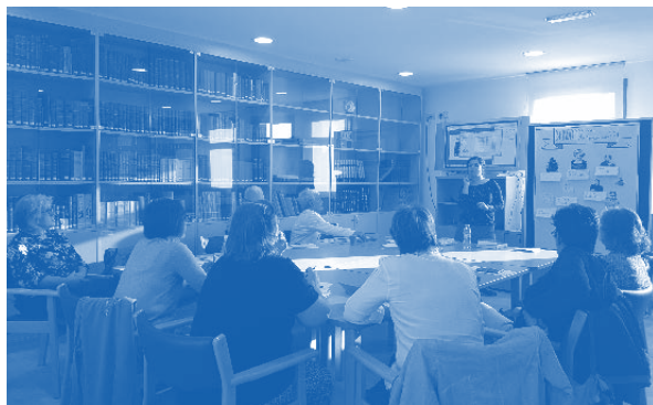
—Obradoiro de investigación participativa no 2019